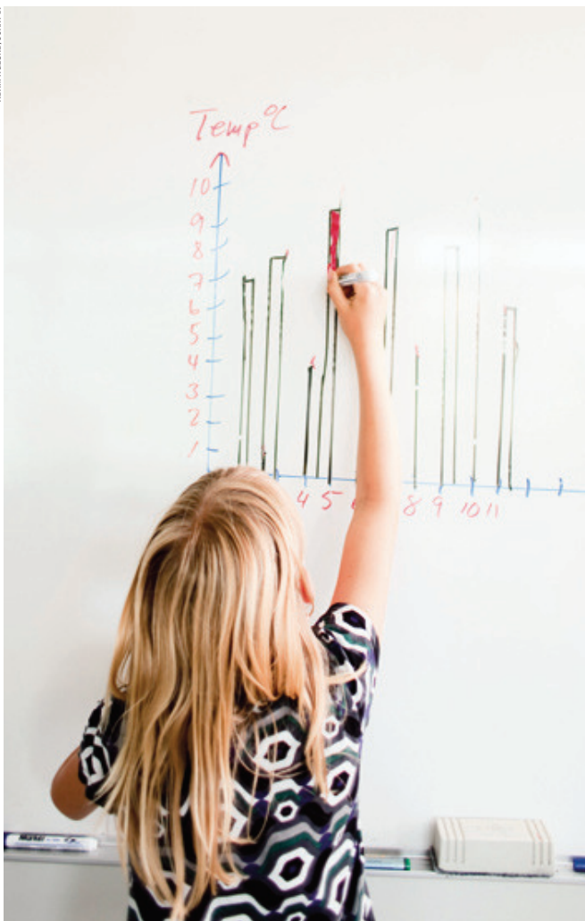
Aldrig tidigare har så många läst så länge för att lära sig så lite.

Ärligheten är behjärtansvärd, men visar på den cynism