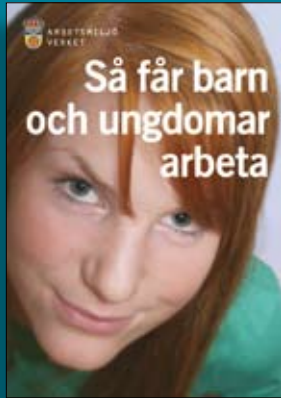
Broschyren: Så får barn och ungdomar arbeta, Best nr ADI 43

På Arbetsmiljöverkets webbplats www.av.se finns föreskrifter och mer information. Fler exemplar av denna folder går att beställa från Arbetsmiljöverkets publikationsservice. Telefon 08-730 97 00, fax 08-735 85 55. E-post: publikationsservice@av.se