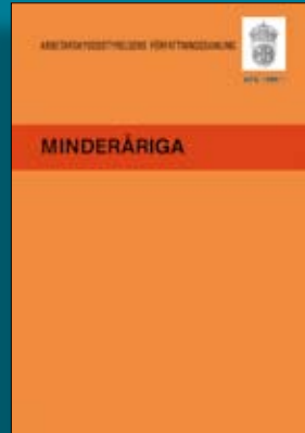
Föreskriften: Minderåriga, AFS 1996:1